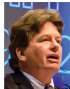
Auteur: Douglas Groothuis Vertaling: Piet Guijt, juli 2017

Hoe eerlijk ze ook waren in het rapporteren over de zwakheden van de discipelen, de evangelisten vertelden nooit van een situatie waarin Jezus intellectueel gedwarsboomd werd of verbeterd in een discussie; ook heeft Jezus nooit een irrationeel of slecht geïnformeerd geloof van de kant van Zijn discipelen aangemoedigd. Met Jezus als ons Voorbeeld en onze Heer, de Heilige Schrift als onze basis (2 Tim. 3:15-17), en de Heilige Geest als onze Leraar (Joh. 16:12-15), zouden wij graag de bijbelse uitdaging moeten aannemen om de wereld te winnen voor Christus en Zijn koninkrijk (2 Kor. 10:3-5).