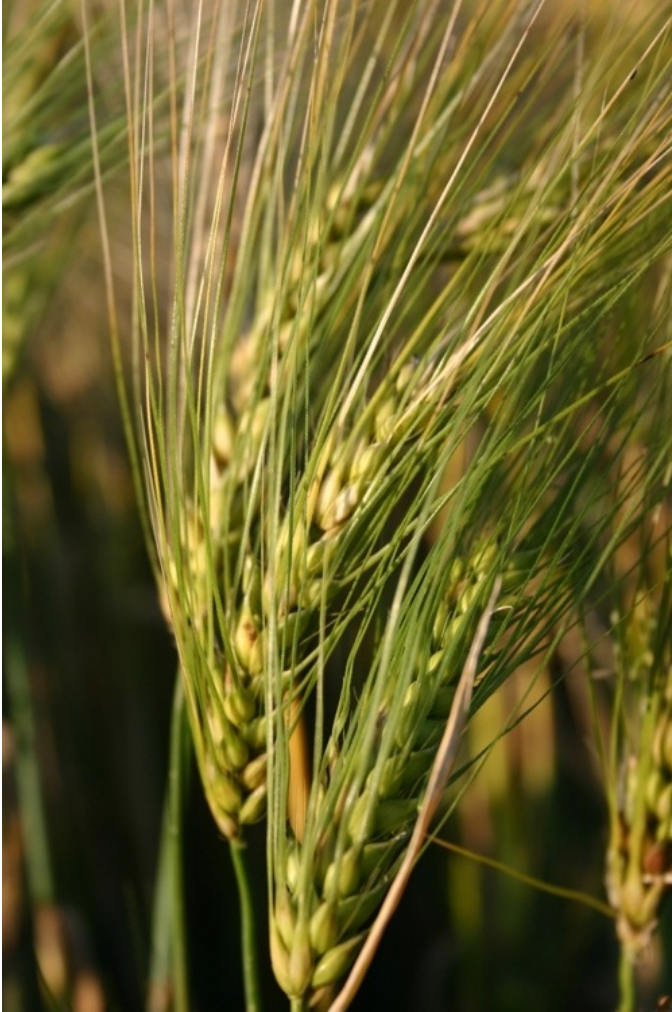
De graankorrel die moet sterven