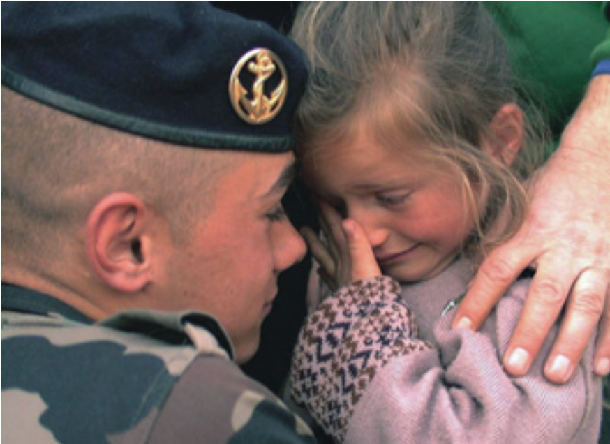
De psychologische behandeling van geweldsslachtoffers

complexiteit ervan (meer dan een miljoen vrouwen lijdt in Nederland onder de gevolgen van seksueel geweld binnen het gezin). Traumaverwerking heeft te maken met meelijden, meehuilen, gevoelens uiten, verbinding ervaren met de ander na verlies, doorbreken van het isolement. Het kan op verschillende niveaus plaatsvinden. Tijdens lotgenotenbijeenkomsten troosten de lotgenoten elkaar. Ruimte krijgen om gevoelens te ervaren en te delen, is op zich al curatief en essentieel in het menselijke leven. Wat is de wereld zonder gevoel? Hetzelfde als een wereld zonder ratio, zonder Logos, zonder God.