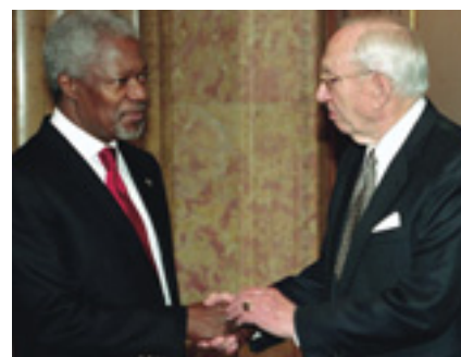
Kofi Annan met de huidige president van de Mormoonse kerk Hinckley

In dit artikel is fundamentele kritiek geuit op de leer en het wettische systeem van de Mormoonse kerk, maar wij willen benadrukken, dat wij de mensen, die in het misleidend systeem gevangen zijn, niet verwerpen of veroordelen. Immers het gaat om mensen met gemeenschapszin en offervaardigheid, om nette, eerlijke en liefhebbende mensen met goede